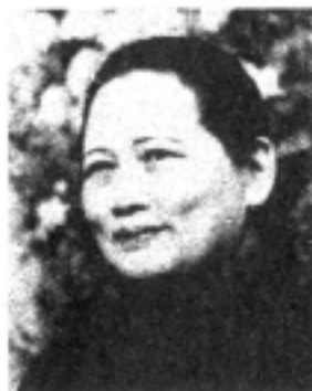
1953年 夫孫文著『建国大綱』 の出版を喜ぶ宋慶齡