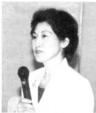
上海宋慶齡基金会訪日団歓迎宴 (2004年9月 日比谷 松本樓)